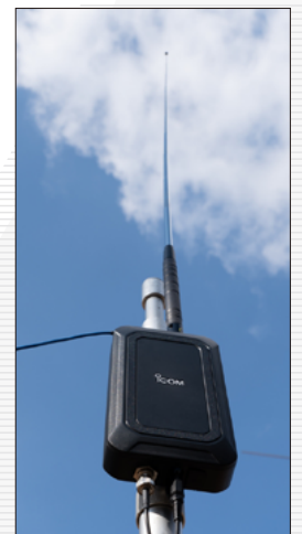
... und mit einer 50-Ω-Antenne.