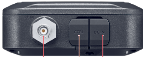
BNC-Buchse (zum IC-705) Buchse für Steuerkabel (zum IC-705) Stromversorgungsanschluss (13,8 V DC)